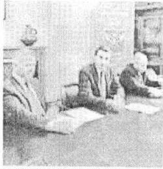
LA CONFERENZA STAMPA DI IERI

L'amministrazione comunale annuncia un nuovo bando in arrivo per l'esenzione dal pagamento della Tassa rifiuti e della Tasi (tassa servizi indivisibili) relativa all'anno 2016 per i cittadini in difficoltà economiche, ovvero chi percepisce un reddito uguale o inferiore a 4.898,25 euro, comprovato da attestazione Isee 2015.